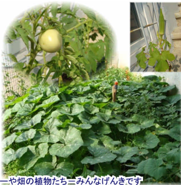
学校のプランターや畑の植物たち—みんなげんきです